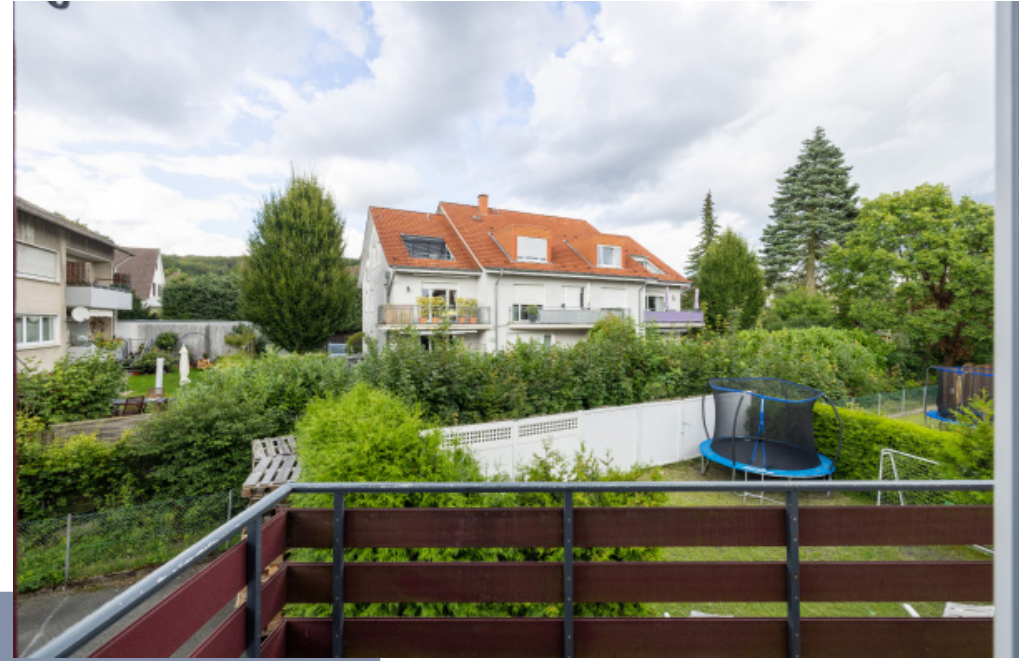
Blick Balkon Küche